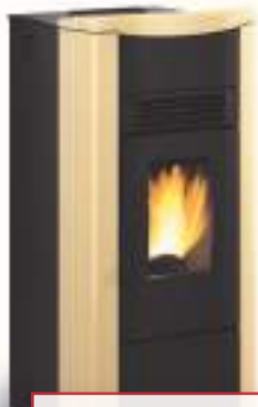
Giusy Plus Evo : version canalisable