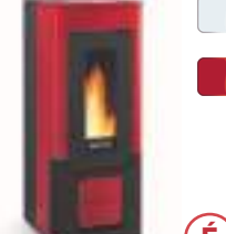
WENDY 10 kW