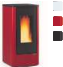
DAHIANA PLUS 10 kW