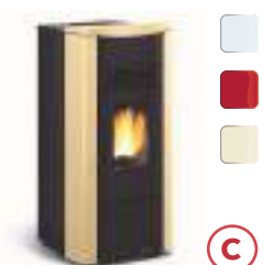
GIUSY PLUS EVO 8 kW