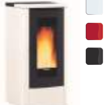
TEOREMA 10 kW