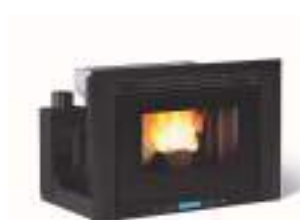
COMFORT P70 H49 7,1 kW