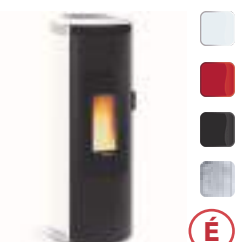
AMIKA 8 kW