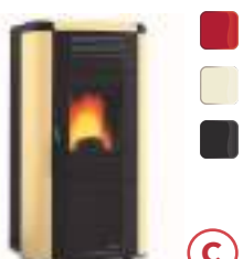
VIVIANA EVO 10,2 kW