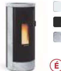
DEBBY CX 9 kW