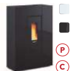
MARILENA PLUS AD CRYSTAL 8 kW