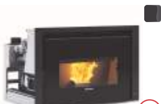
COMFORT P85 PLUS 12 kW