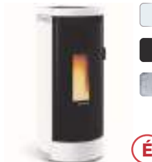
DEBBY 9 kW