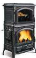
ISOTTA CON CERCHI EVO