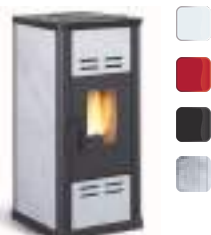
SERAFINA 7 kW