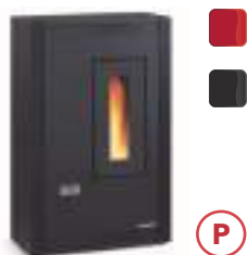
LUISELLA 4,4 kW