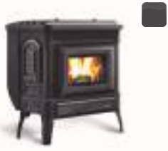
TEODORA 8,7 kW