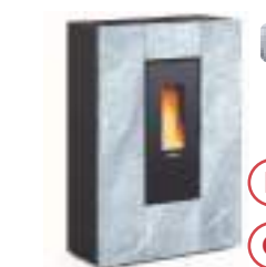
MARILENA PLUS AD PETRA 8 kW