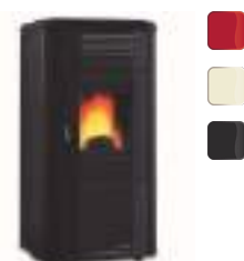
VIVIANA PLUS EVO 10,3 kW