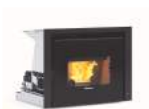
COMFORT P70 AIR 10 kW