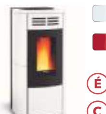
TERRY PLUS 12,1 kW