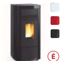
ANGELA SP 8 kW