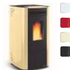
KETTY EVO 6,5 kW