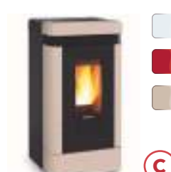
LUCIA PLUS 12,1 kW