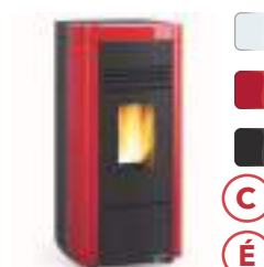
ANGELA PLUS SP 8 kW