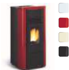
GIUSY EVO 7 kW