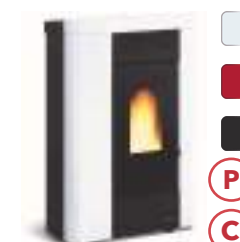
ANNABELLA 8 kW