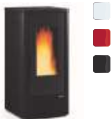
DAHIANA 10 kW