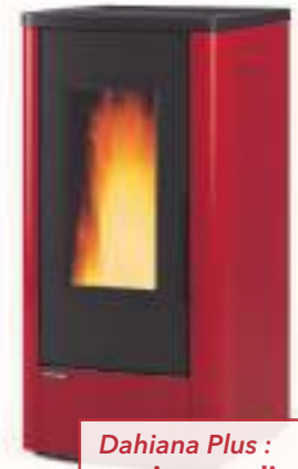
Dahiana Plus : version canalisable