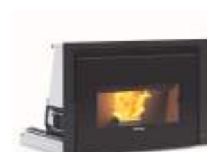
COMFORT P85 12 kW