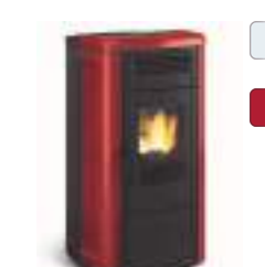
NOVELLA EVO 10,2 kW