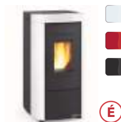
MOIRA SP 6,5 kW