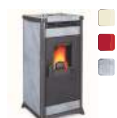
IRMA 10,3 kW