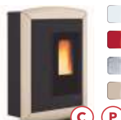
SOUVENIR LUX 10,2 kW