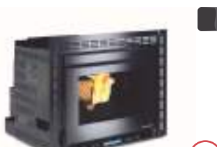
COMFORT PLUS CRYSTAL 11 kW