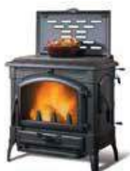
ISOTTA FORNO EVO