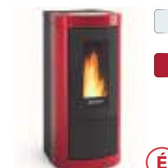
MIETTA 8 kW