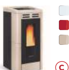
ANASTASIA PLUS 12 kW